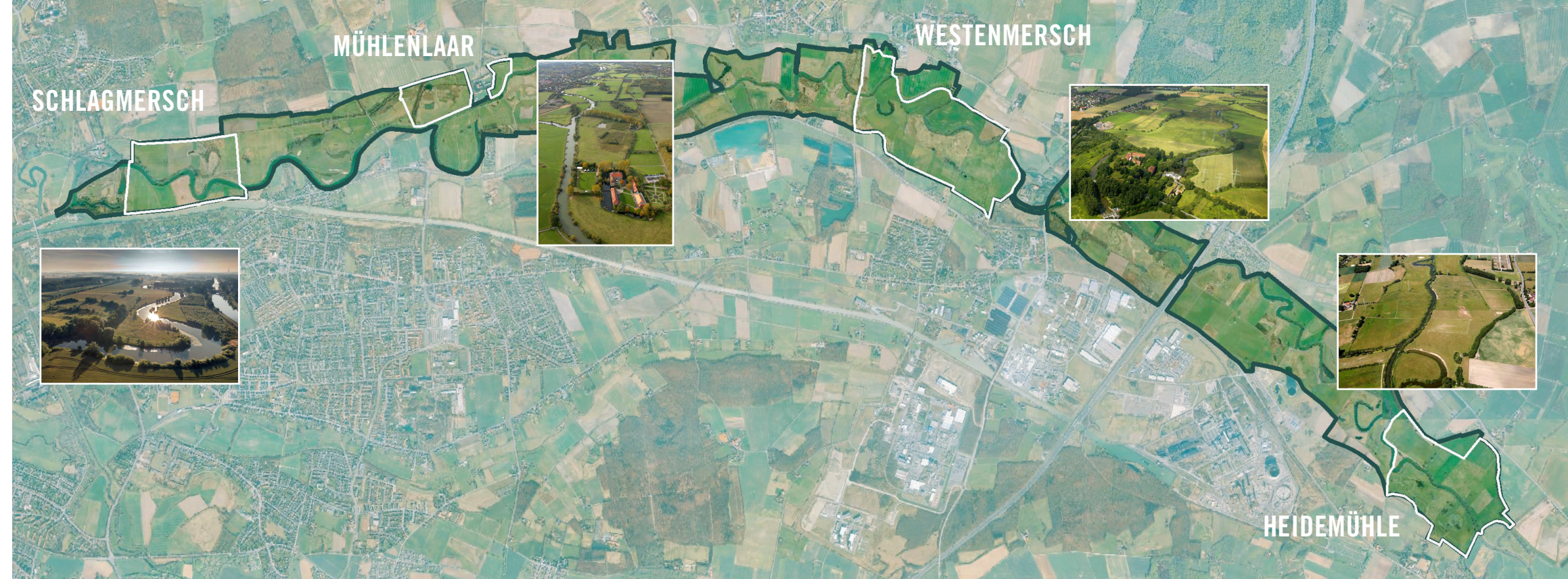
Auf der Karte sind die vier Maßnahmenblöcke zu erkennen, in denen die Lippeaue auf einer Fläche von 182 Hektar naturnah umgestaltet wird. Sie liegen innerhalb des farblich hervorgehobenen FFH-Gebietes „Lippeaue zwischen Hangfort und Hamm“.

Das Projektgebiet umfasst das gesamte 615 ha große FFH-Gebiet „Lippeaue zwischen Hangfort und Hamm“. Es erstreckt sich von Welper-Hangfort (Kreis Soest) bis Hamm-Heessen (Stadt Hamm). In diesem Bereich wurden bereits im vergangenen LIFE-Projekt fünf Teilauenträume optimiert. Das LIFE+ Projekt will nun die Lebensräume von Tieren und Pflanzen in vier weiteren Teilauenträumen (sogenannte „Maßnahmenblöcke“) auf einer Fläche von rund 180 ha verbessern. Aus mehreren einzelnen Teilräumen entsteht so ein zusammenhängender naturnaher Auenraum.