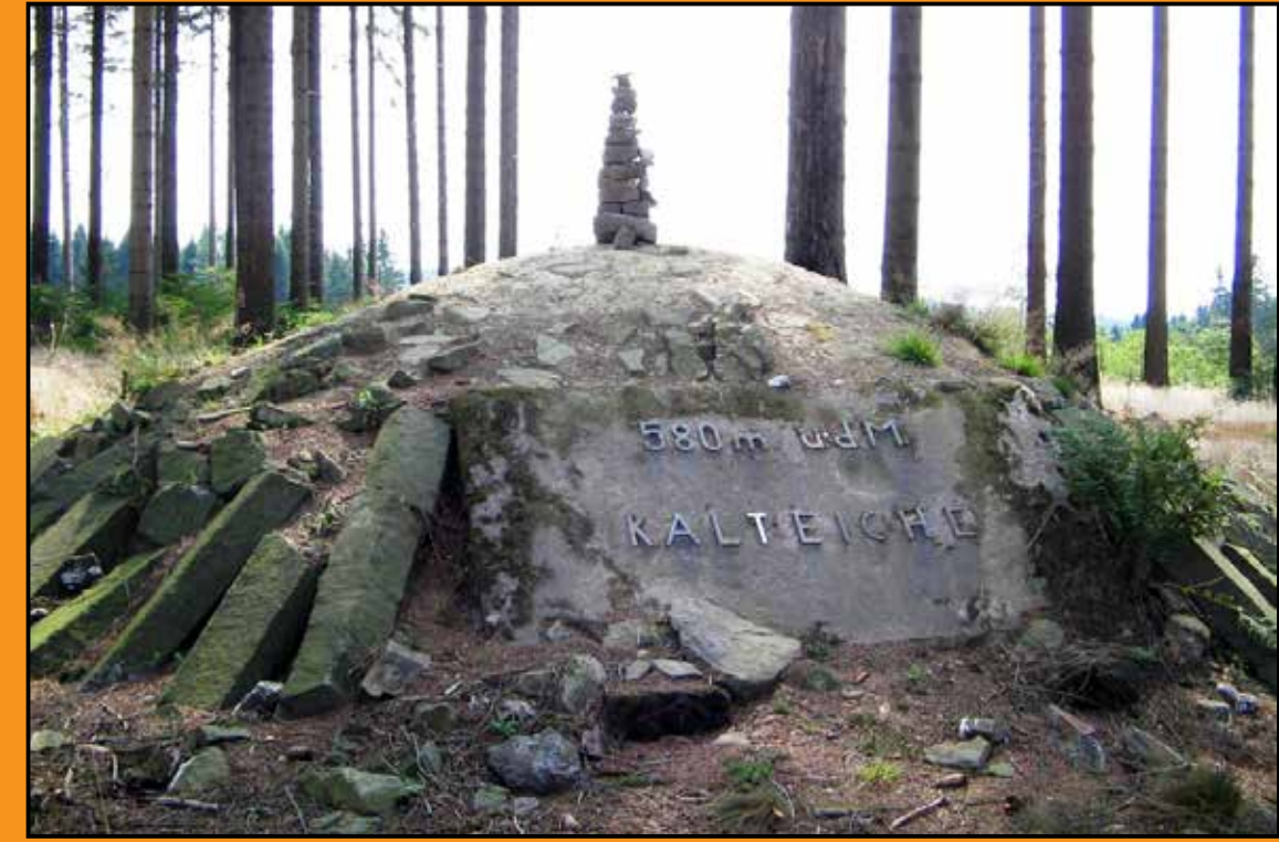
Höchster Punkt - Kalteiche